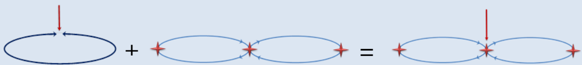
Рис. 1. Комбинация двух базовых символов в символ эсхатологической стратегической инициативы

На титул книги вынесен символ эсхатологической стратегической инициативы. Он является комбинацией двух символов, приведенных на рис. 1.