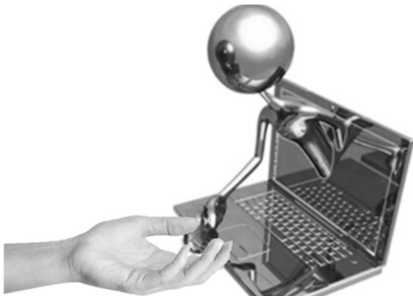
Рис. П.1. Искусственный интеллект как дружелюбный партнер, помогающий человеку использовать компьютеры для выхода в интернет

темы, но без сокращений и упрощений, которые могут привести к искажению смысла. В каждом абзаце книги содержится чистая правда — хотя иногда далеко не вся.